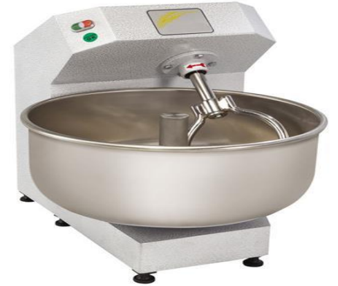
Hamur Yoğurma Makinesi