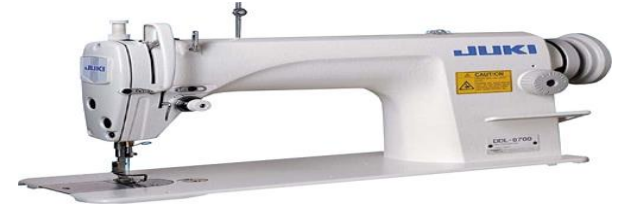
Sanayi tipi dikiş makinesi