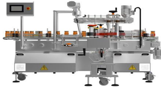
Kavanoz kapama makinesi