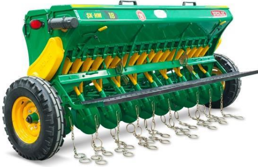
Tohum ekme makinesi