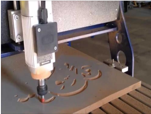
Ahşap işleme makinesi