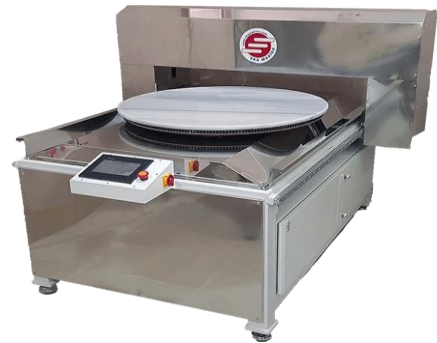
Yufka açma makinesi