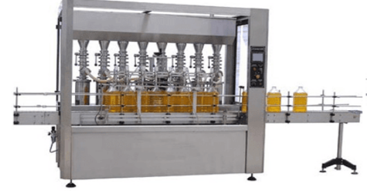
Otomatik dolum makinesi